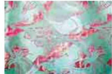
In alto Minghi a sinistra un'opera di Valentini esposta a Novilara di Pesaro e sopra un tessuto della mostra «Nodi di seta alla corte di Urbino»