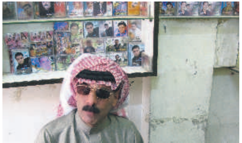
Il compositore siriano Omar Souleyman

voli disillusioni, eppure non rinunciò mai a combattere per le sue idee. Cosicché la parte più intrigante del libro è l'aver colto il nesso inscindibile tra arte, politica e vita di Bernstein: vuoi nelle sue scelte come direttore e ancor più in quelle di compositore, dai musical e i balletti, dal carattere popolare, all'opera Candide , alla sacrilega Mass , fino alle composizioni sinfoniche più ambiziose. Facendo emergere non il direttore patinato delle copertine dei dischi, ma finalmente la figura di un musicista cosciente del proprio ruolo nella società. ●