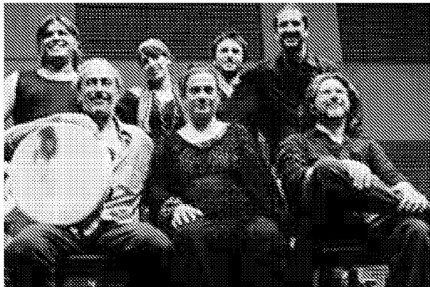
Officina Zoe tra gli ospiti del festival

E targata Turchia, l'edizione 2010 di Adriatico Mediterraneo, il festival che da quattro anni colora la fine dell'estate anconetana. Una manifestazione che convoglia su di sé l'attenzione di analoghi festival nel Mediterraneo, da Hammamet a Gerusalemme e da Cartaro al Cairo, dove Adriatico Mediterraneo presenta e presenterà sue produzioni musicali di spicco. E il clou è qui, dal 28 agosto al 5 settembre, da Vanvitelli a Vanvitelli: come dire lungo tutto il waterfront, dalla Mole all'Arco di Traiano, all'Arco Clementino, un altro dei nuovi spazi del festival, assieme alla suggestiva e misteriosa Casa del Capitano, che sarà riaperta per la Notte Mediterranea, sabato 4 settembre. Uno zibaldone di ap-