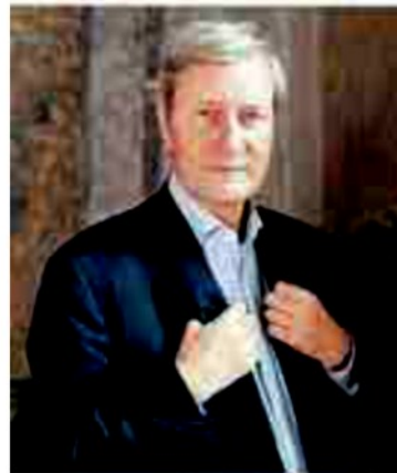
Larici a pag. 52 Gianni Vattimo

tana, indignata dalle frasi choc contro Israele pronunciate dall'intellettuale ai radiomicrofoni de "La Zanzara". La comunità ebraica ha ritirato il patrocinio. Basta? No. Vattimo verrà premiato oggi pomeriggio alle 17 alla Loggia dei Mercanti in una cerimonia inaugurale che si preannuncia a dir poco imbarazzante. Chi gli consegnerà il riconoscimento materialmente? Le autorità sinora si sono defilate. Poi Vattimo sarà protagonista alle 21.30 alla Corte della Mole di un incontro per riflettere e discutere sul significato di parole come Confini, Europa e Stato.