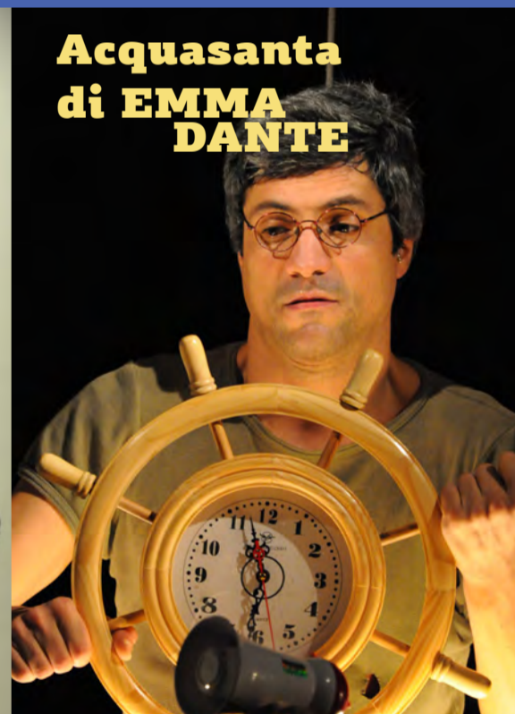
Acquasanta di EMMA DANTE