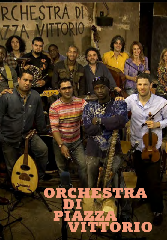
ORCHESTRA DI PIAZZA VITTORIO